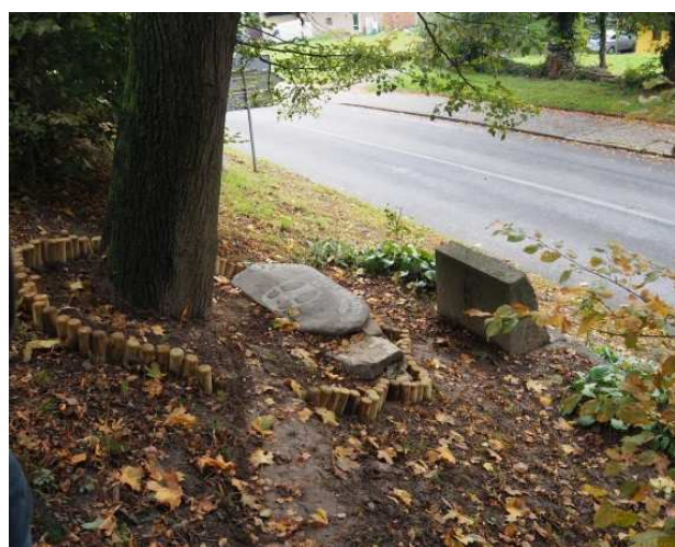
Kazatelna pod Lípou Komenského

Covidem narušené oslavy budou pokračovat do r. 2022 (430 let narození J.A. Komenského).