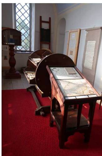
Expozice Dědictví Komenského