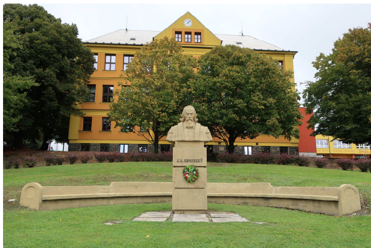
J.A.Komenský před školou v Suchdole n.O.